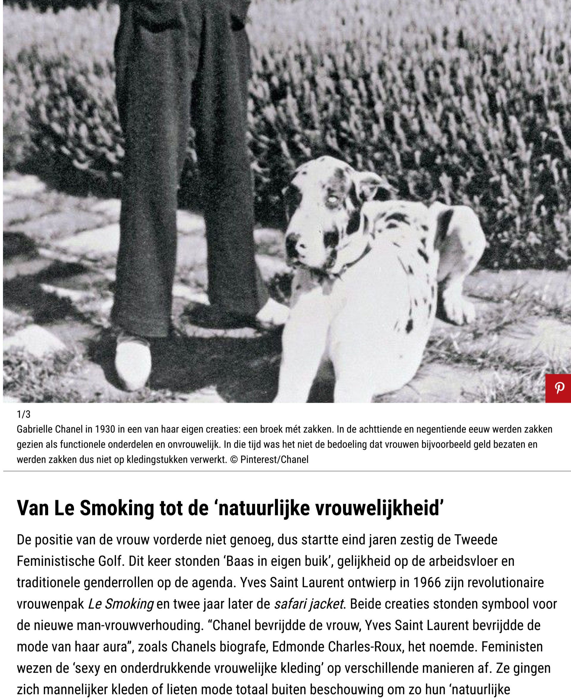
1/3 Gabriëlle Chanel in 1930 in een van haar eigen creaties: een broek mét zakken. In de achttiende en negentiende eeuw werden zakken gezien als functionele onderdelen en onvrouwelijk. In die tijd was het niet de bedoeling dat vrouwen bijvoorbeeld geld bezaten en werden zakken dus niet op kledingstukken verwerkt.

Emancipatie speelde in de twintigste eeuw een steeds grotere rol. Vooral vanaf eind jaren zestig is mode in zwang gekomen als gebruikelijk communicatiemiddel om feministische issues aan de kaak te stellen. Maar eigenlijk is het al vanaf ongeveer 1900 een topic. De eerste generaties feministen waren bijlange na niet alleen vrouwen die hun beha's in de fik staken, rondrenden in paarse tuinbroeken en mannen haatten. Liberaal, radicaal, sociaal... het feminisme kende verschillende stromingen met bijbehorende kledingstijlen. De Eerste Feministische Golf startte rond 1900 en streed voornamelijk voor vrouwenkiesrecht en toegang tot hoger onderwijs. De vrouwonterende korsetten en crinolines werden ingeruild voor draagbare silhouetten. In de jaren twintig werd zelfs het ondenkbare mogelijk: vrouwen droegen steeds vaker broeken. Een ontwikkeling waar Gabriëlle Chanel met haar praktische en op mannenkleding geïnspireerde ontwerpen een groot aandeel in had.