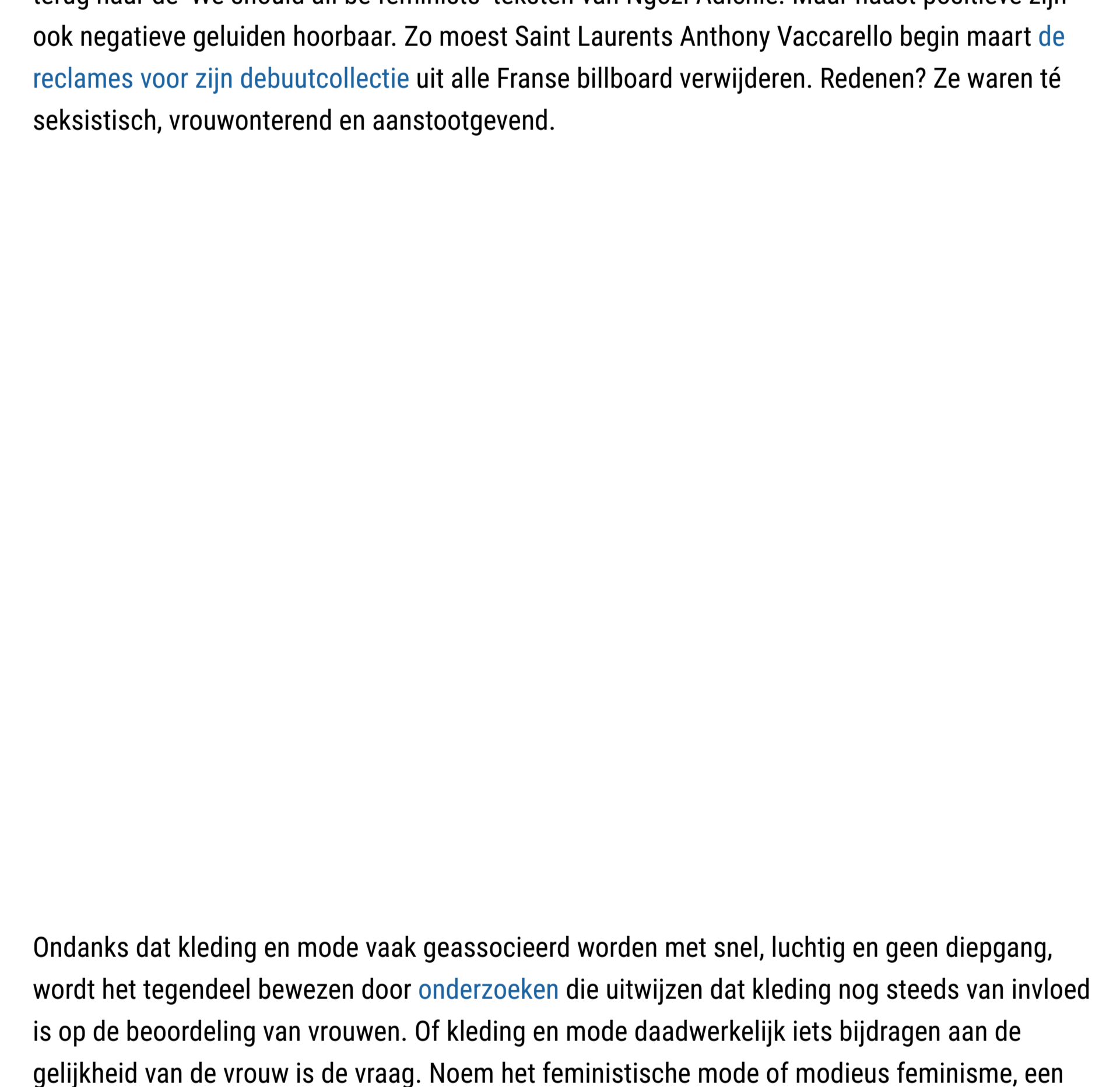
3/3 De laatste jaren zien we een opleving van feministische statements in de modewereld. Links een ontwerp uit de lente/zomer 2014-collectie van Prada en rechts een creatie uit de lente/zomer 2017-collectie van Dior.

In de modewereld zochten steeds meer ontwerpers naar een nieuwe vrouwelijkheid waarmee ze zich afzette tegen de traditionele genderverschillen in de mode. Een goed voorbeeld hiervan is het werk van Vivienne Westwood . In eerste instantie verwerkte Westwood subculturele elementen uit de punk in haar eigentijdse kleding. De bad girl was geboren. Na de vercommercialisering van de punk, verschoof Westwoods interesse in de jaren tachtig naar onder meer het technische aspect van de Victoriaanse mode. Dit zorgde voor collecties met draagbare bustes, korsetten en crinolines waarmee ze het vrouwelijk lichaam juist benadrukte. Voor Westwood waren haar ontwerpen een vrouwelijk machtsmiddel: "De beste titel die ik ooit meegaf aan een collectie was Vive La Cocotte (1995). Hiermee wilde ik vrouwen uitdagen: zie koketterie als kracht. Ja, wij kunnen mannen manipuleren: nee, we moeten niet op hen willen lijken."