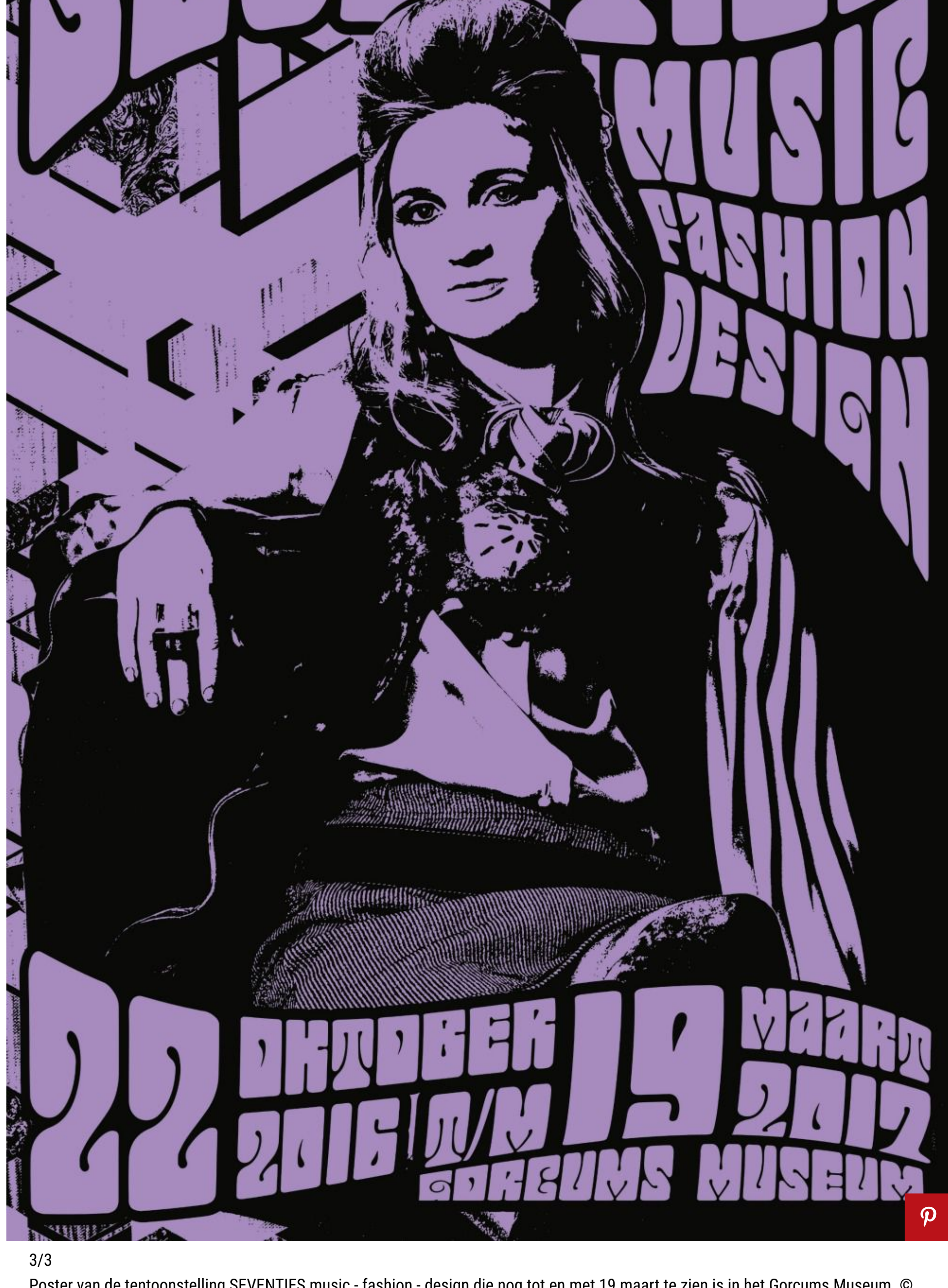
3/3 Poster van de tentoonstelling SEVENTIES music - fashion - design die nog tot en met 19 maart te zien is in het Gorcums Museum.