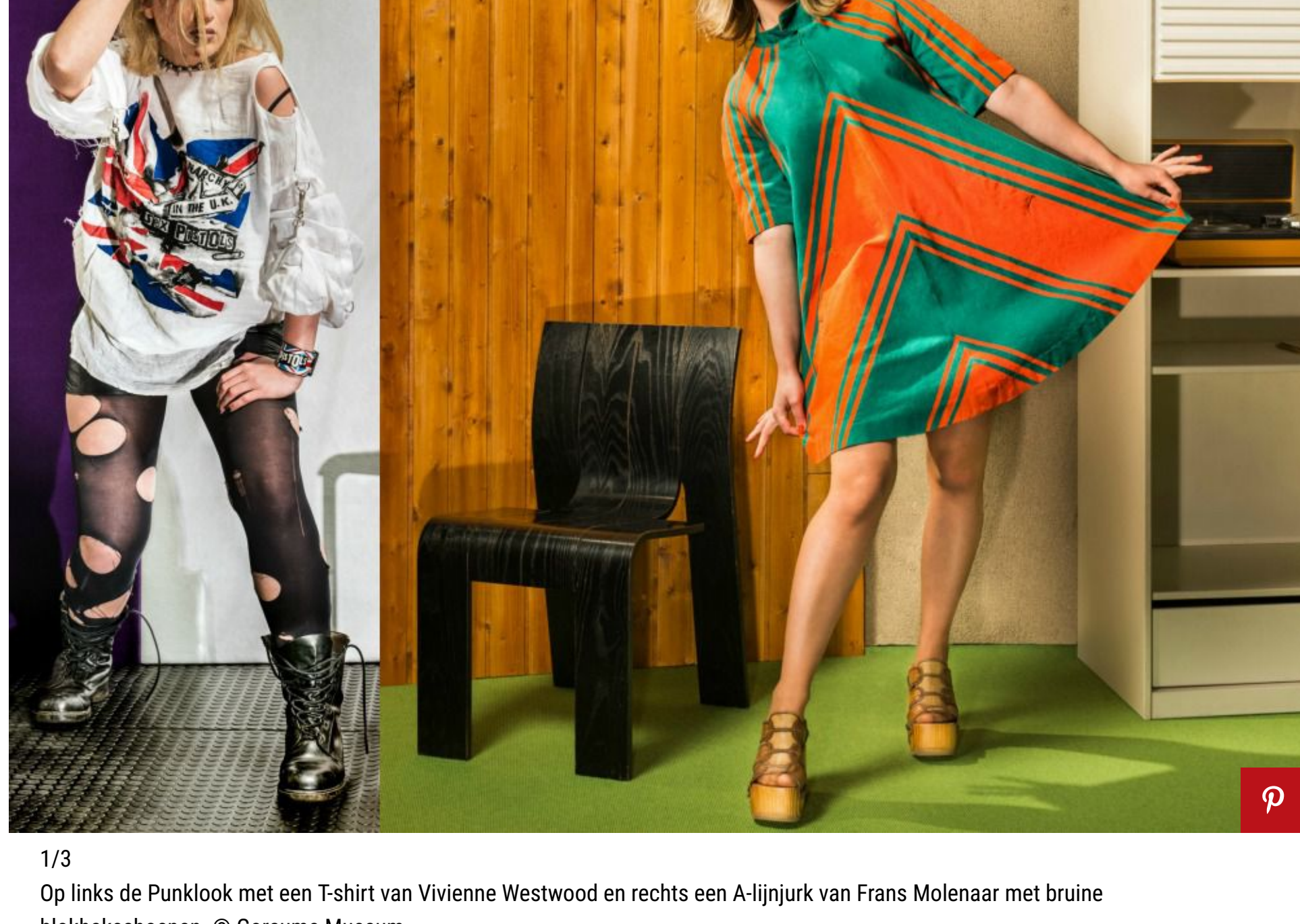
1/3 Op links de Punklook met een T-shirt van Vivienne Westwood en rechts een A-lijnjurk van Frans Molenaar met bruine blokhak schoenen.

De jaren zeventig van de twintigste eeuw waren in alle opzichten woelig. De wereld stond op haar kop door de vele protesten tegen kernbepapening, milieuverontreiniging en de abortuswetgeving. Vanzelfsprekend leidden deze veranderingen in de maatschappij tot andere muziek-, design- en modestijlen. De Nederlandse hitlijsten stonden bomvol punk, disco, slow pop, glamrock en hardrock met George Baker Selection en Golden Earring als de Nederlandse parapadaarden. Het interieur kleurde steeds meer oranje, bruin en paars en voor de mode van de zeventiger jaren werd de jeugd- en straatcultuur de grootste bron van inspiratie. Kortom: 1970-1979 werd het decennium met een van de meest bonte en contrasterende verzameling aan stijlen ooit.